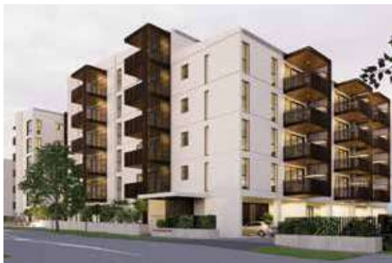
'Ūuni 'apātimeni 'a e pule'angá 'i Ōwairaka