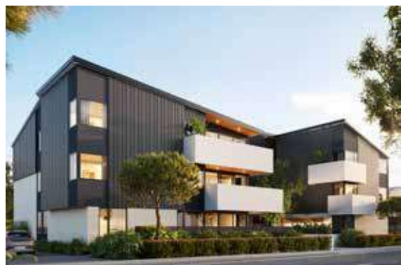
'Ū 'api Walk-up 'i Ōwairaka